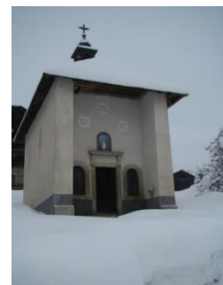
Chapelle Notre Dame des Anges à Vauvray