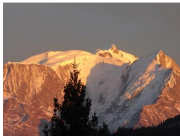
Le mont Blanc dans le salon d'un chalet d'Ormaret

Demi-quartelain et quartelaine de cœur depuis 40 ans, ma femme et moi passons 2 à 3 mois par an à Ormaret dans un cadre enchanteur, très apprécié par notre grande cordée de 8 enfants et beaux-enfants et 12 petits enfants. Fervents montagnards quand nous étions plus jeunes nous avons arpenté des cimes que nous voyons de notre chalet. Aujourd'hui nous méditons devant toutes ces beautés de la Création, ce qui a fait dire à un de nos amis venu nous voir : «Mais vous avez le Mont-Blanc dans votre salon !!! »