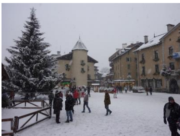
La Mairie l'hiver