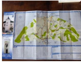
Plan de la Commune

Demi-Quartier, une petite commune de Haute-Savoie, de 985 habitants (plusieurs milliers en saison), nichée entre Megève et Combloux, est une véritable curiosité dans différents domaines : topographie, urbanisme, histoire.